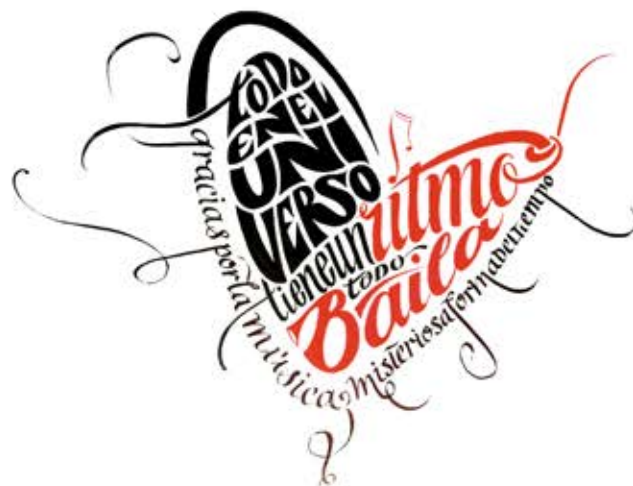
Mural de Ana Navarro: "Música en los Rincones"

En esta nueva edición, este evento contará con 14 espacios emblemáticos en callejuelas y rincones de municipio, para dar cabida a 15 artistas, bandas o grupos representativos de diferentes géneros musicales